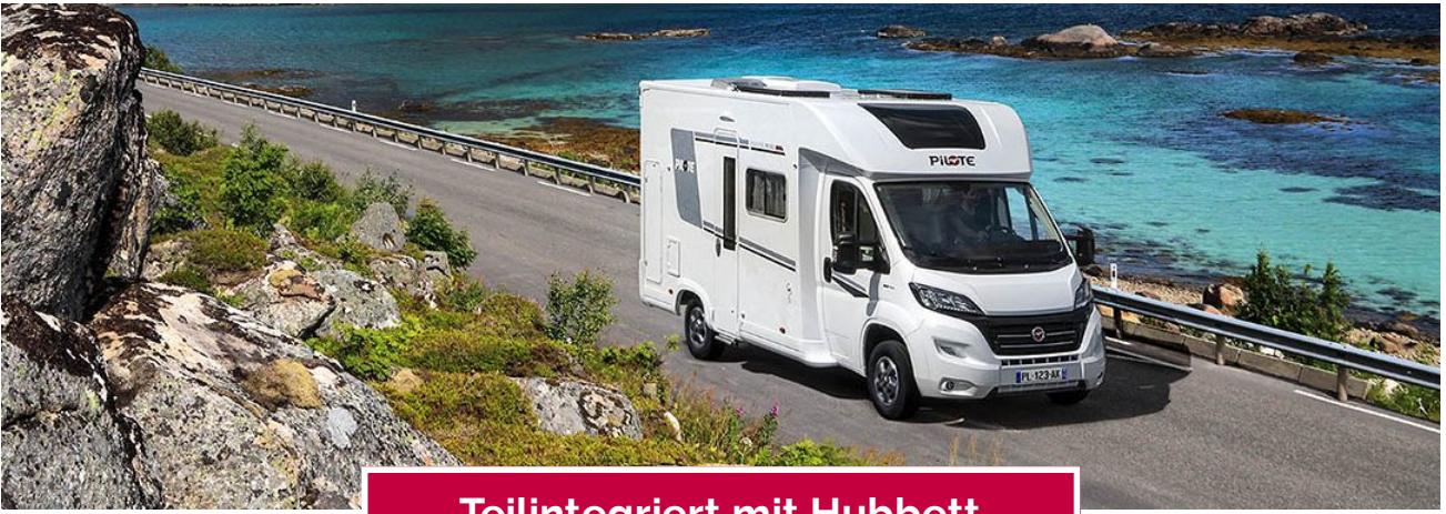
Teilintegriert mit Hubbett P726FGJ